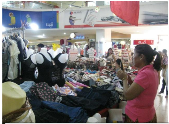
จำหน่ายสินค้าทั่วไป คล้ายห้างมาบุญครองของไทย