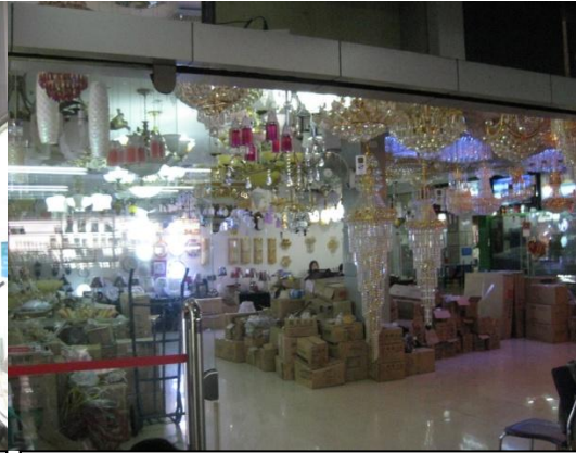
ร้านจำหน่ายคอมไฟ รูปลักษณะนิทานี้ ราคาจีน