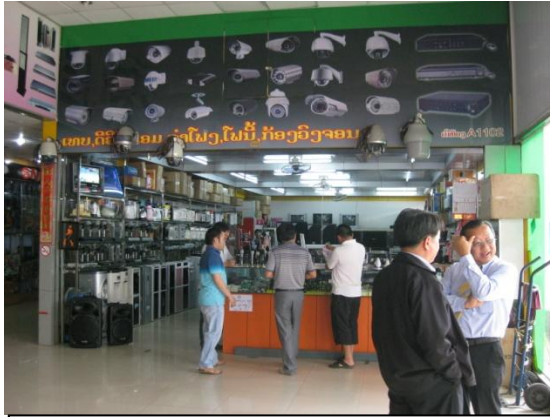
ร้านจำหน่ายเครื่องใช้ไฟฟ้าจากจีน