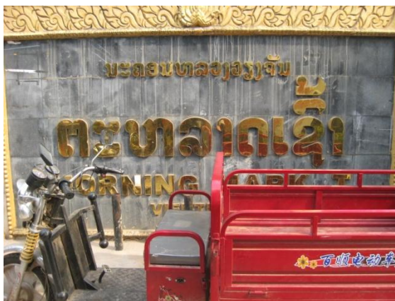
ตลาดเช้าเวียงจันทน์

ตลาดเช้า เวียงจันทน์ เป็นตลาดศูนย์กลางจำหน่ายสินค้าสำคัญในเมืองเวียงจันทน์ ที่ชื่อว่าตลาดเช้าเนื่องจากเมื่อก่อนนี้ เปิดทำการเฉพาะตอนเช้า แต่ต่อมาได้ขยายเวลาจำหน่ายสินค้ามาเป็นทั้งวัน สินค้าส่วนใหญ่ที่ตลาดแห่งนี้เป็นสินค้าอุปโภคบริโภคประจำวัน สินค้าที่ผลิตจากประเทศไทยได้รับความนิยมมากในประเทศลาว เนื่องจากเป็นสินค้าที่มีคุณภาพ และความใกล้เคียงทางด้านภาษาและวัฒนธรรม คนลาวสามารถเข้าใจภาษาไทย ทั้งภาษาพูดและภาษาเขียนได้ดี ทั้งนี้เพราะประชาชนลาวรับสื่อโทรทัศน์จากประเทศไทย แม้นั่งสือ นิตยสาร ตำราภาษาไทย ก็มีขายทั่วไปในตลาดลาว