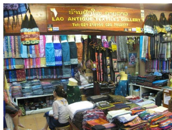
จำหน่ายสินค้าหัตถกรรมลาว