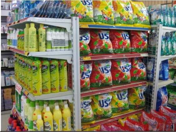
สินค้าไทยเป็นที่นิยมในลาว