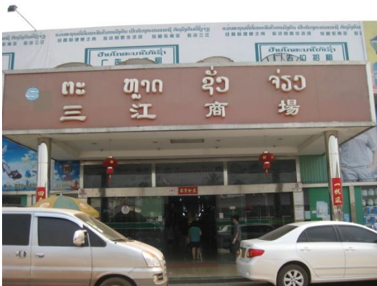
“ไชน่าทาวน์” ในลาว

รูปแบบการจัดตั้งและดำเนินการของศูนย์จำหน่ายสินค้าจีนนี้ ถูกมองว่าเป็นรูปแบบที่จีนใช้เพื่อรุกเพื่อกระจายสินค้าจีนสู่ตลาดในประเทศต่างๆทั่วโลก และอาจเป็นลักษณะเดียวกับที่จะเปิดศูนย์ค้าส่งสินค้าจีนในประเทศไทย