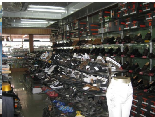
สินค้านำเข้าจากจีน