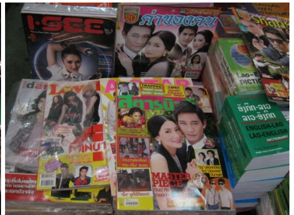
นิตยสารไทยก็ได้รับความนิยมไม่แพ้สินค้าไทย

ผลจากการศึกษาตลาดทั้งสองแห่งนี้ ทำให้ผู้ประกอบการไทยได้เข้าใจตลาด รสนิยม และพฤติกรรมของผู้บริโภคลาว ผู้ประกอบการได้เห็นโอกาส และศักยภาพตลาดของสินค้าไทย ตลอดจนถึงคู่แข่งในตลาด ได้แก่สินค้านำเข้าจากจีน และเวียดนาม แต่จากการสอบถามจากผู้บริโภคทำให้ทราบว่า สินค้าไทยมีส่วนแบ่งตลาด 70 % เมื่อเทียบกับสินค้าคู่แข่ง เพราะสินค้าไทยมีคุณภาพดีกว่าสินค้าคู่แข่ง