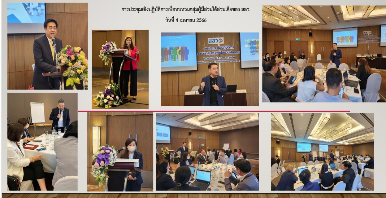
ภาพที่ 1: การประชุมเชิงปฏิบัติการเพื่อทบทวนกลุ่มผู้มีส่วนได้ส่วนเสียของ สสว. เมื่อวันที่ 4 เมษายน 2566 สรุปภาพรวมการดำเนินการ

ณ โรงแรมเซ็นทารา แกรนด์ แอท เซ็นทรัลพลาซ่า ลาดพร้าว กรุงเทพฯ