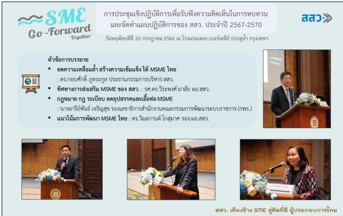
ภาพที่ 4: การประชุมเชิงปฏิบัติการเพื่อรับฟังความคิดเห็นในการทบทวนและจัดทำแผนปฏิบัติการของ สสว. ประจำปี 2567-2570 เมื่อวันที่ 20 กรกฎาคม 2566

สสว. ได้จัดการประชุมเชิงปฏิบัติการเพื่อรับฟังความคิดเห็นในการทบทวนและจัดทำ แผนปฏิบัติการของ สสว. ประจำปี 2567-2570 (กลุ่ม VOS กลุ่มทางตรงและทางอ้อม ที่เป็นหน่วยงานภายนอก) ภายใต้แนวคิด “SME Go Forward Together ” เพื่อให้แผนปฏิบัติการของ สสว. สอดคล้องกับทิศทางการพัฒนา ประเทศ นโยบายรัฐบาล แผนยุทธศาสตร์ชาติ 20 ปี แผนแม่บทต่างๆ และแผนการส่งเสริม SME รวมถึงประเด็น ความต้องการและความคิดเห็นจากผู้มีส่วนได้ส่วนเสียของ สสว. โดยการประชุมดังกล่าวมีผู้เข้าร่วมการประชุมจาก หน่วยงานภาครัฐ ภาคเอกชน ผู้ประกอบการ SME และผู้บริหาร สสว. จำนวน 145 ราย โดยสรุปประเด็นสำคัญจาก การประชุมได้ดังนี้