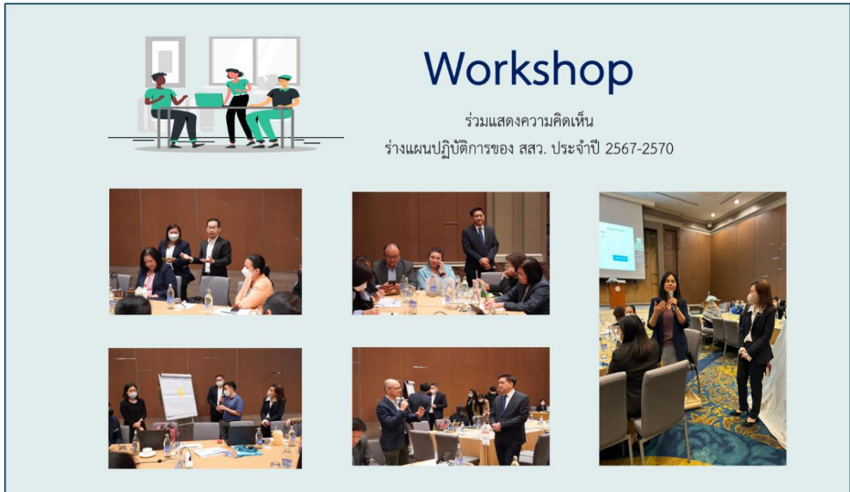
ภาพที่ 6: บรรยากาศการประชุมเชิงปฏิบัติการ (Workshop) เพื่อให้รับฟังความคิดเห็นต่อร่าง แผนปฏิบัติการของ สสว. ประจำปี 2567-2570