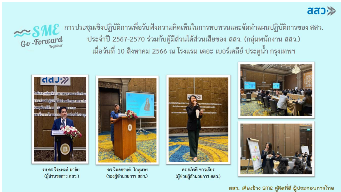
ภาพที่ 7: การประชุมเชิงปฏิบัติการเพื่อรับฟังความคิดเห็นในการทบทวนและจัดทำแผนปฏิบัติการของ สสว.

ประจำปี 2567-2570 ร่วมกับผู้มีส่วนได้ส่วนเสียของ สสว. (กลุ่มพนักงาน สสว.) เมื่อวันที่ 10 สิงหาคม 2566