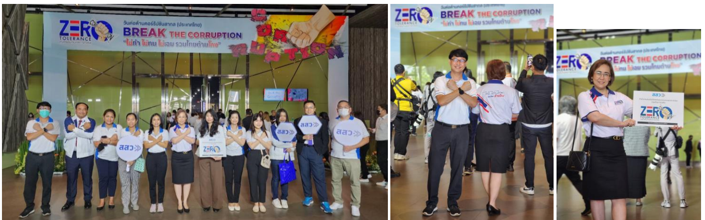
ฝ่ายทรัพยากรบุคคล (สสว.)